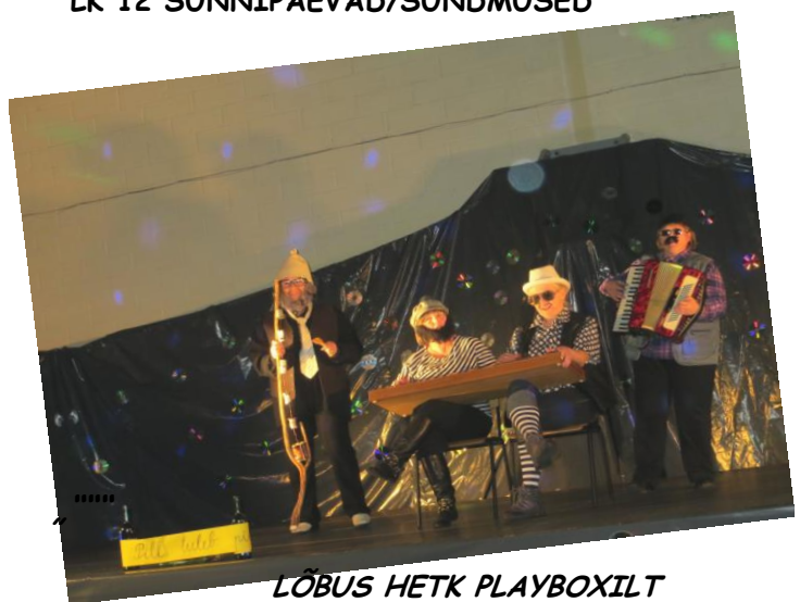
LÖBUS HETK PLAYBOXILT