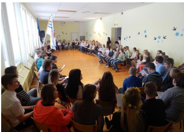
Sõbralikus ringis ühislaulmise tunnis „Mu isamaa armas“