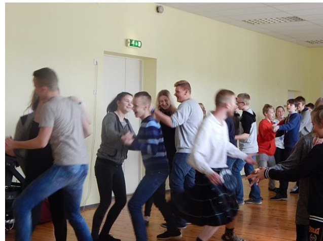
Fotol hetk hoogsast tantsutunnist