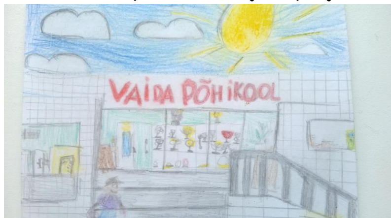
Caspar Raudkivi joonistus