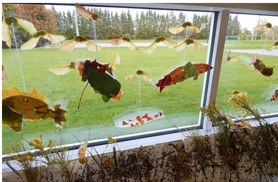
1.klass „Kalade maailm“

Merekultuuri-aastast lähtudes valmisid selleaastased tööd teemal „Nagu merelaine“