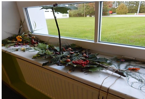
4.klass „Noa laev“