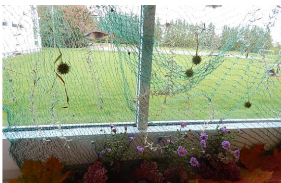
5.klass „Imeline veemaailm“