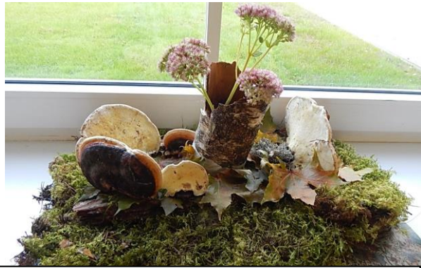
8.klass „Jäämurdja „Suur Tõll“