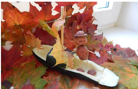
3.klass „Dilk merele“