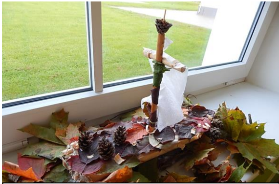
7.klass „Läbi lainete“