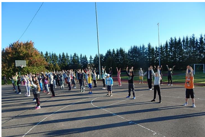
Soojendus enne spordivõistlust

Sel aastal tähistati Eestis teistkordselt üle-euroopalist spordinädalat. Spordinädala eesmärgiks on tõsta elanikkonna liikumisharrastuse ja spordialast