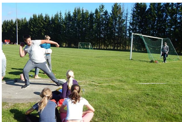
Kaur Teras kuuli tõukamas

Spordinädala lõpetasime reedel meeleolukate Just Dance vahetundidega!