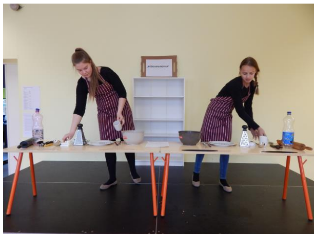
Martha Rosler „Semiotics of the Kitchen“