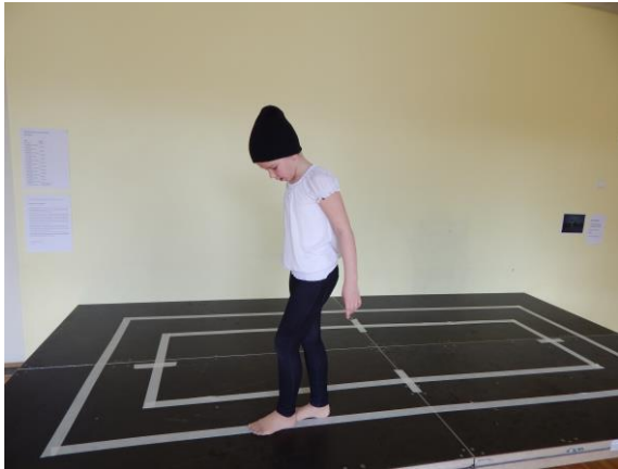
Bruce Nauman „Walking in an Exaggerated Manner around the Perimeter of a Square“